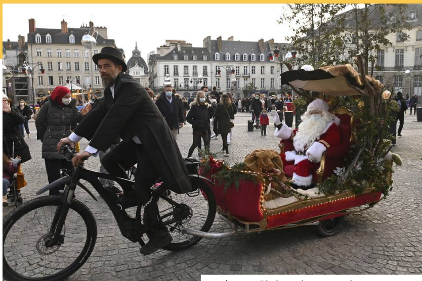
Le Père Noël dans les rues de Rennes